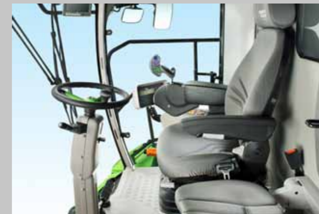
DEUTZ-FAHR C6000 - wnętrze kabiny.

Przekonaj się, że kombajn DEUTZ-FAHR jest w Twoim zasięgu i sam możesz poczuć jego legendarną już wydajność i niezawodność. Wystarczy zapytać Dealera o najnowszą ofertę.