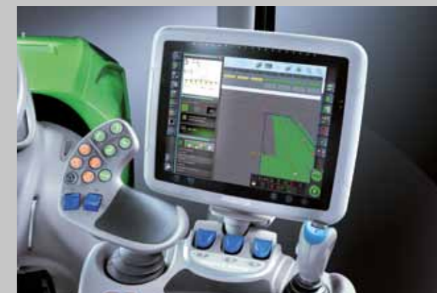
AGROSKY- system rolnictwa precyzyjnego.