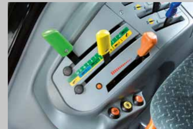
Konsola sterowania DEUTZ-FAHR 5080D.