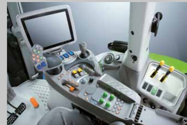
Modele RCshift / TTV.