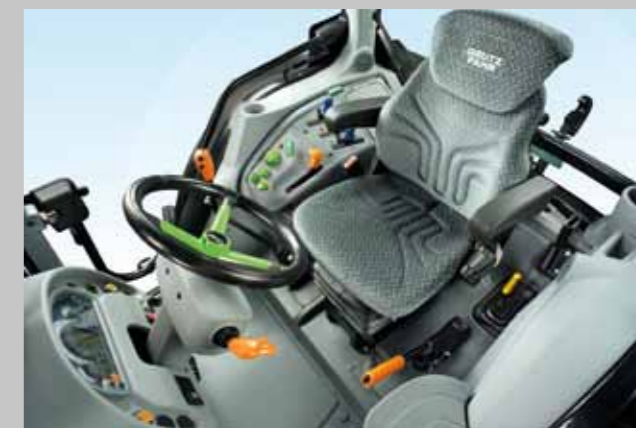
Wnętrze kabiny DEUTZ-FAHR 5080D.