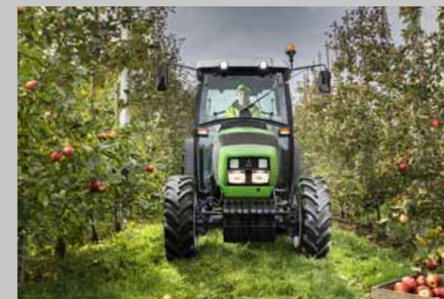
Idealne gabaryty do pracy w międzyrzędziach.

*wartość netto wkładu własnego w finansowaniu na 3 lata bez odsetek, w ratach półrocznych. Kampania obowiązuje do 30 listopada 2017. DEUTZ-FAHR zastrzega sobie prawo wcześniejszego zakończenia promocji w przypadku wyczerpania ilości dostępnych ciągników.