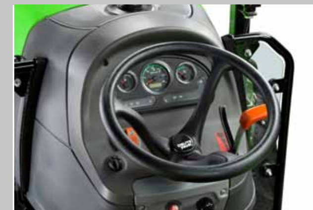
InfoCenter. Doskonały podgląd na funkcje ciągnika.