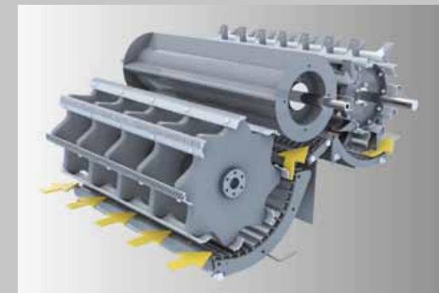
System omlotu z turboseparatorem.