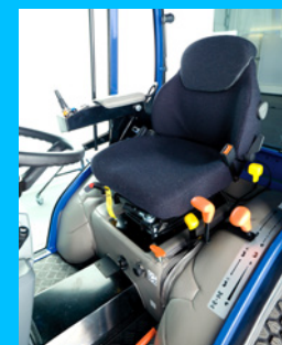
Ergonomiczny fotel operatora regulowany w 5 punktach.