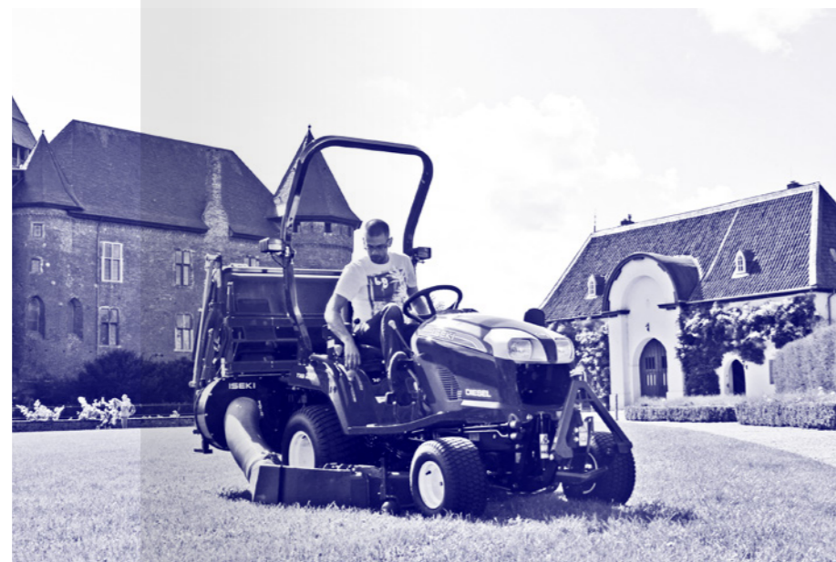
Kosz na trawę i liście o pojemności 550l.

Prace porządkowe to często projekty wielozadaniowe Zgarnianie, grabienie, transport, koszenie, zmiatanie – oto codzienność zarządcy terenu. TXG 2 to niezawodny asystent.